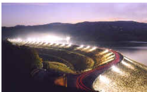
Lago di Bilancino