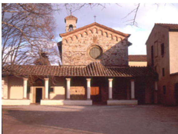
Bosco ai Frati