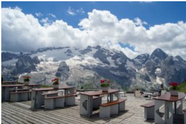
VIEL DEL PAN - Marmolada dal Rif. Gorza